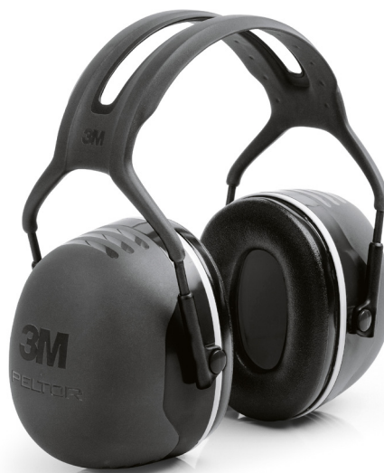
▲ Słuchawki ochronne 3M Peltor X 3M, USA, www.3m.com

Zapewniliśmy ochronę głowy i uszu, ale czy to wystarczy? Absolutnie nie. Przecież prawie każda czynność, którą wykonujemy, wymaga użycia rąk, prawda? A więc i je musimy zabezpieczyć. W tym celu doskonale sprawdzają się rękawice, które ochronią nasze dłonie, zapewniając bezpieczeństwo podczas pracy. Także one muszą być wygodne, najlepiej niezbyt grube i wytrzymałe. To cechy produktu szwedzkiej firmy Guide – zaprojektowane przez nich rękawice robocze są cieńsze i bardziej wytrzymałe od klasycznych skórzanych modeli. Rękawice te wykonane są z miękkiego materiału wersji Serino, dzięki czemu zapewniają pewny chwyt; jasne akcenty kolorystyczne sprawiają, że rękawice wyglądają sportowo i nowocześnie.